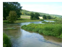
La gestion et l'entretien des cours d'eau