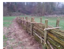
Les aménagements d'hydraulique douce