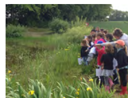
L'éducation à l'environnement