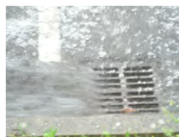
Le conseil sur la gestion des eaux pluviales