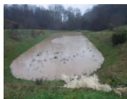
Les ouvrages de régulation