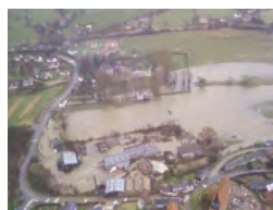
Les mesures de prévention du risque d'inondation