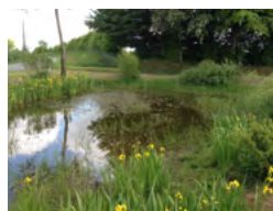
La reconquête des mares