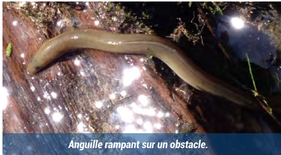
Anguille rampant sur un obstacle.

C'est un poisson migrateur amphihalin : au cours de sa vie l'anguille va passer par des milieux d'eau douce et d'eau salée. Elle se reproduit en mer. Précisément dans la mer des sargasses (au large de la Floride), à de telles profondeurs que personne n'a jamais pu voir la reproduction d'une anguille !