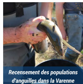
Recensement des populations d'anguilles dans la Varenne

L'anguille est aujourd'hui une espèce menacée en Europe. Sa présence dans les cours d'eau du bassin de l'Arques est un privilège qu'il faut absolument préserver !