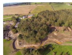
La restauration de la continuité écologique des rivières