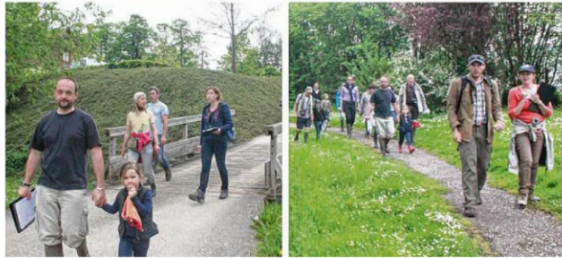
A la première halte, on essaie de repérer les essences d'arbres.

ou préservées ou au contraire éradiquées, tant leur colonisation pourrait porter préjudice au reste de l'environnement.